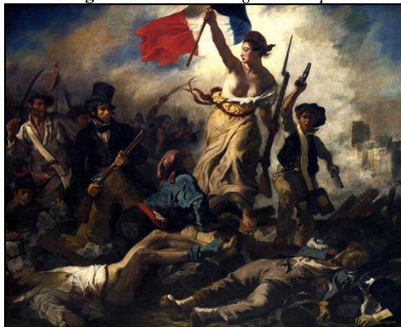
Figura 1: A Liberdade guiando o povo

Delacroix, nascido em 1798, filho de político, frequentou a Escola de Belas Artes em 1816. No início da carreira dedicou-se às obras religiosas e históricas e posteriormente, o Romantismo 6 . Por volta de 1820 retoma as obras históricas, sendo as principais: O Assassinato do Bispo de Liège (1829) e A liberdade guiando o povo (1831) (vide figura 01).